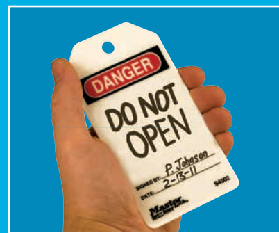
Nouveau message prêt pour le projet suivant