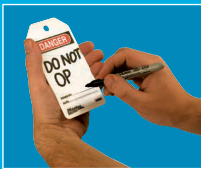
Étiquette nettoyée prête pour le message suivant – écrivez un autre message à l'aide d'un marqueur permanent