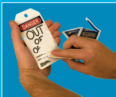
Effacez le message inscrit à l'aide d'alcool isopropylique

Inscrivez le message correspondant à la tâche avec un marqueur, effacez-le une fois le travail terminé et réutilisez le panneau/l'étiquette pour la tâche suivante.